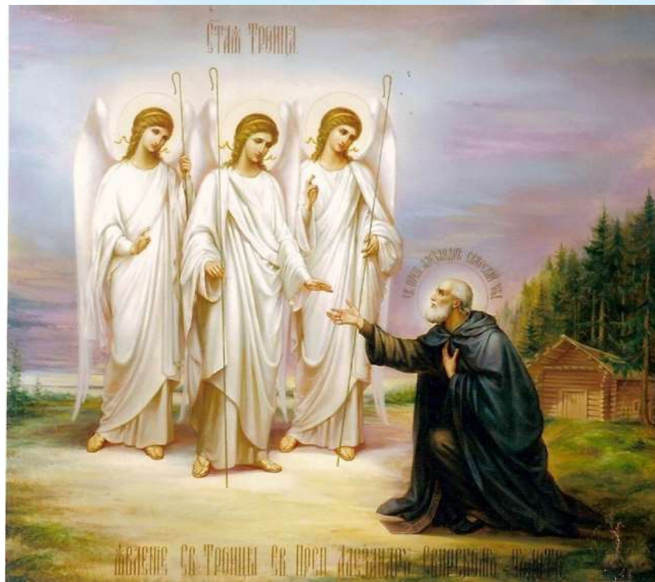
Явление Троицы преподобному Александру Свирскому. Икона.