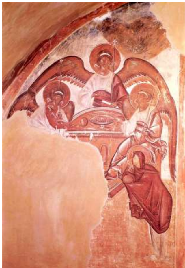
Феофан Грек. Икона. Явление Троицы Аврааму