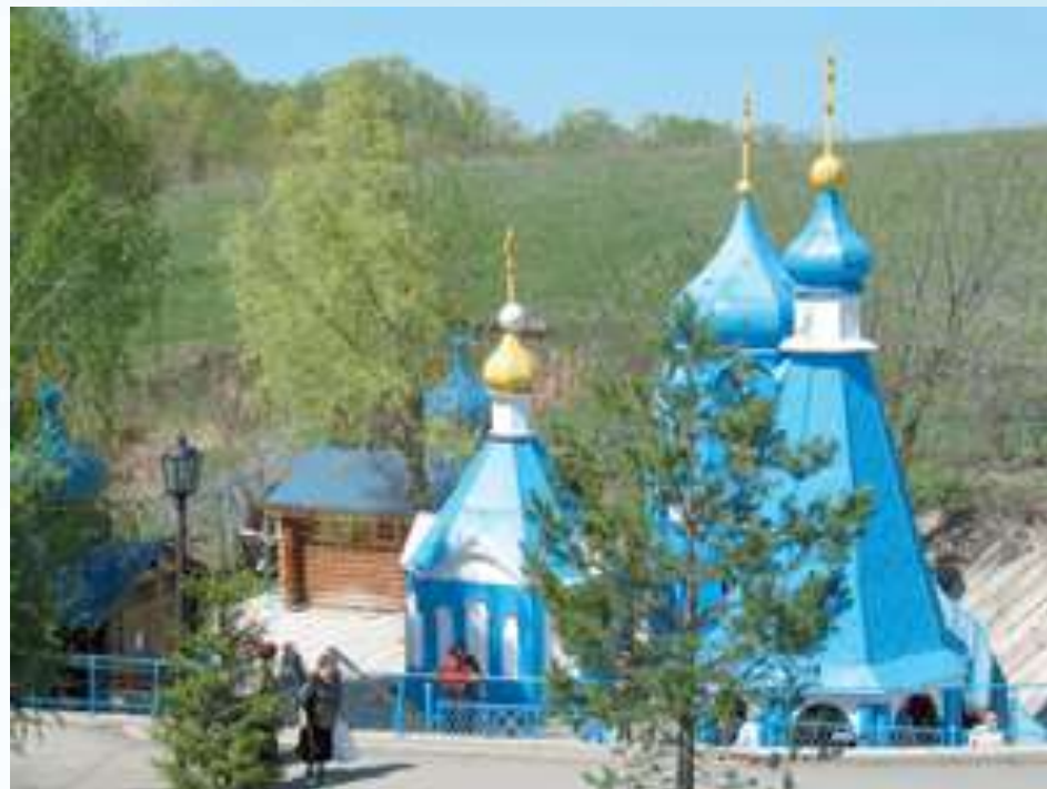
Святой источник в селе Ташла, в честь чудотворной иконы Божией Матери «Избавительница от бед»