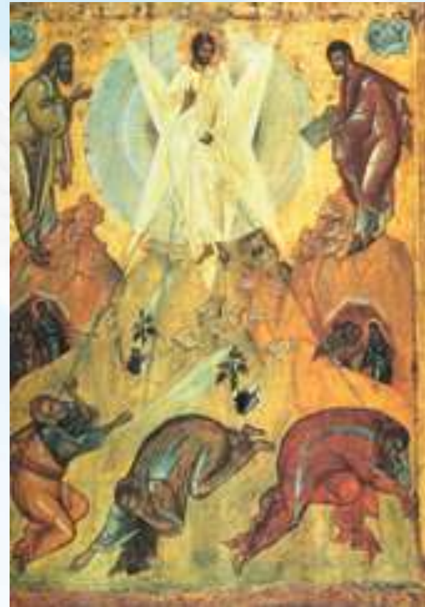
Преображение Господне. Икона. Феофан Грек