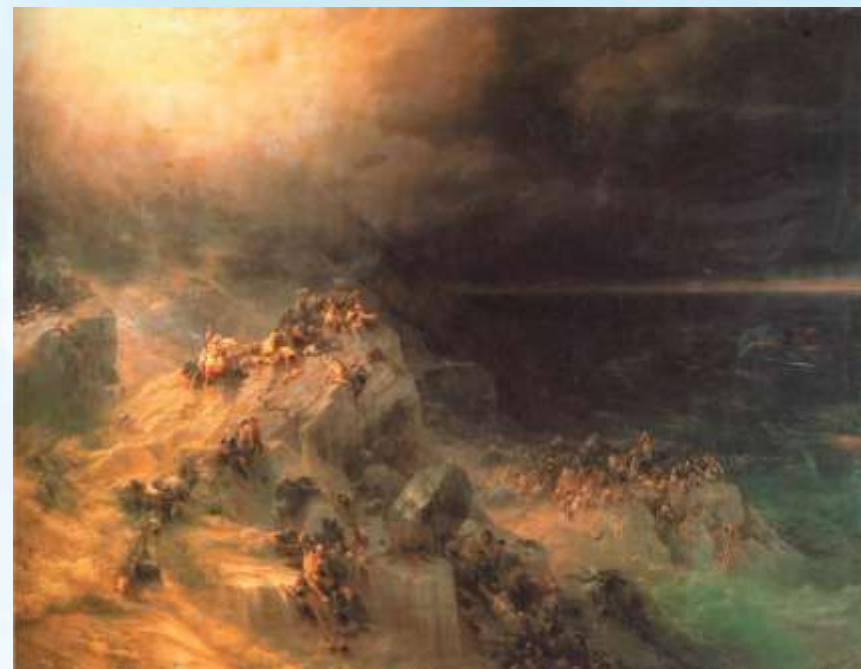
И. Айвазовский. Всемирный потоп.