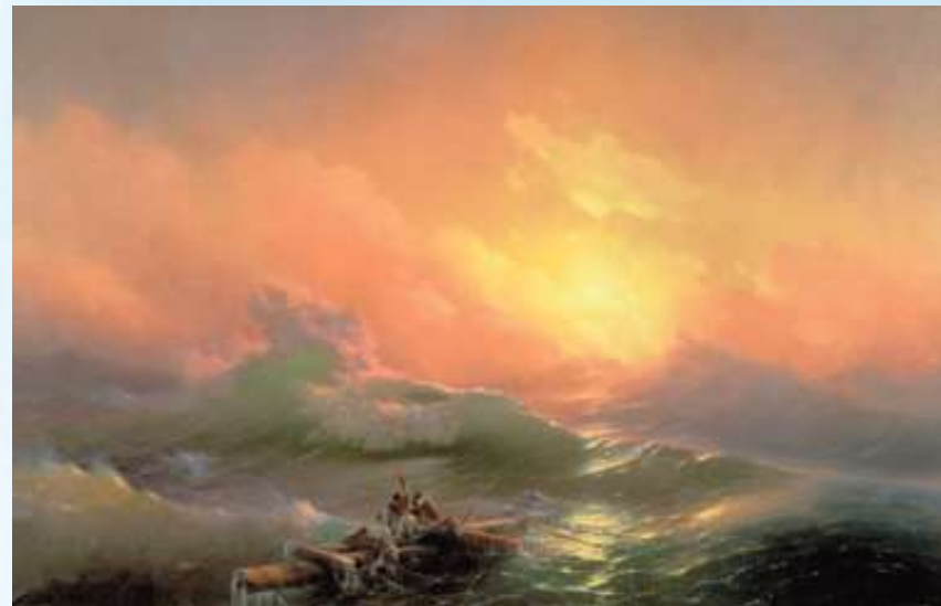
И.Айвазовский . Девятый вал.