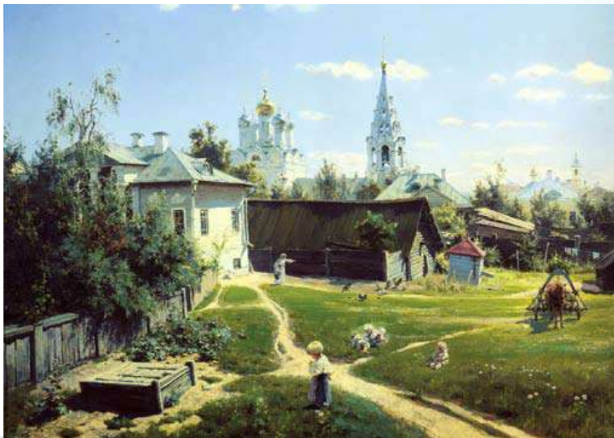
И. Поленов. Московский дворик