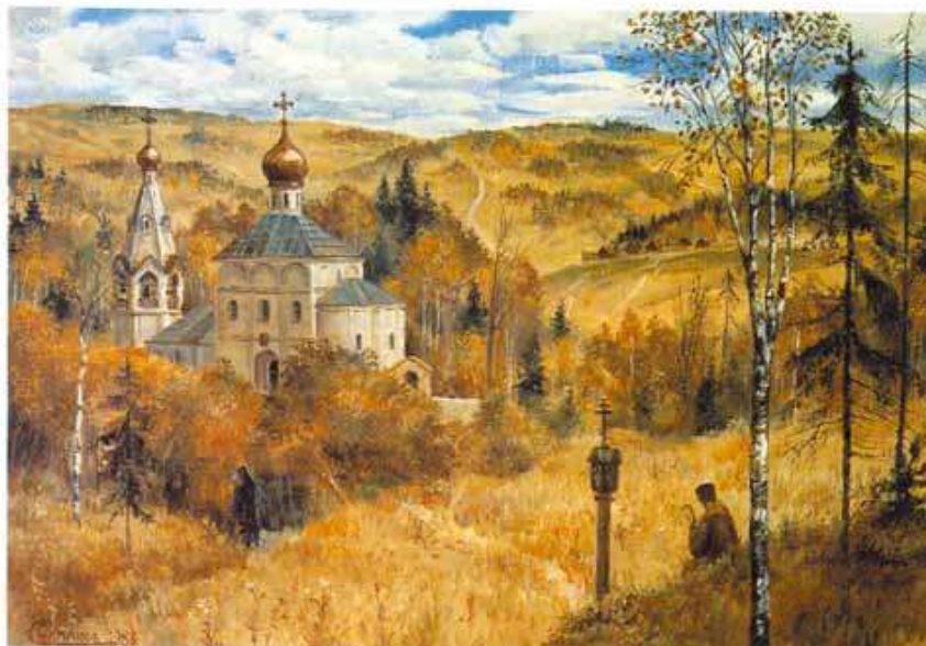
С. Симаков. Светлая осень