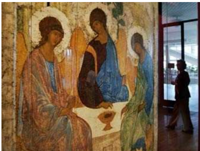
Троица. Икона. Андрей Рублёв

Великая тайна кроется В иконе «Святая Троица»! Идет от неё благодать, А тайну... не разгадать!