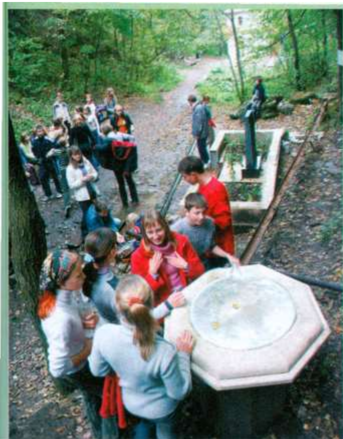
Жигули. Каменная Чаша. Источник св. Николая Чудотворца