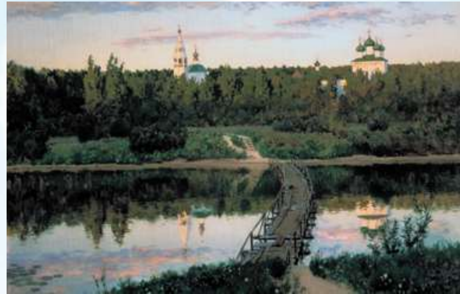
И. Левитан. Тихая обитель