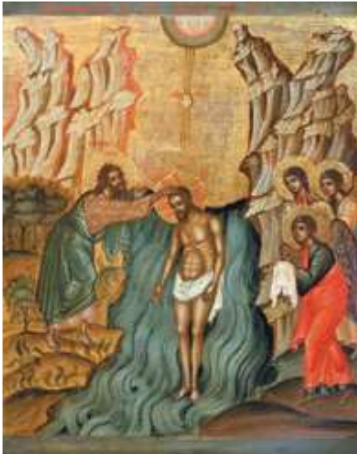
Крещение Господне (Богоявление). Икона