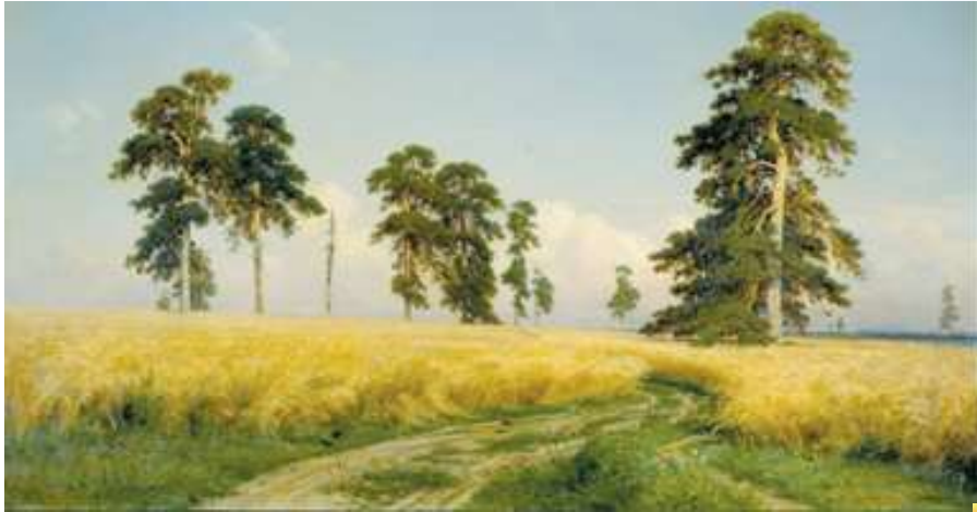
И. Шишкин. Рожь