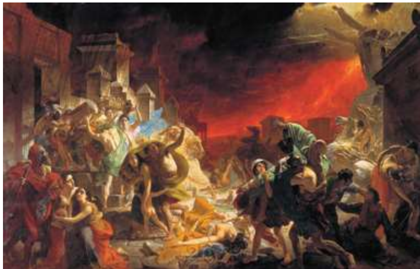
К.Брюллов. Гибель Помпеи