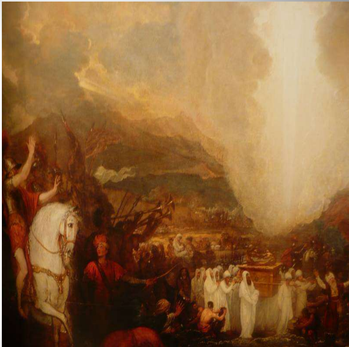
Бенджамин Вест. Картина