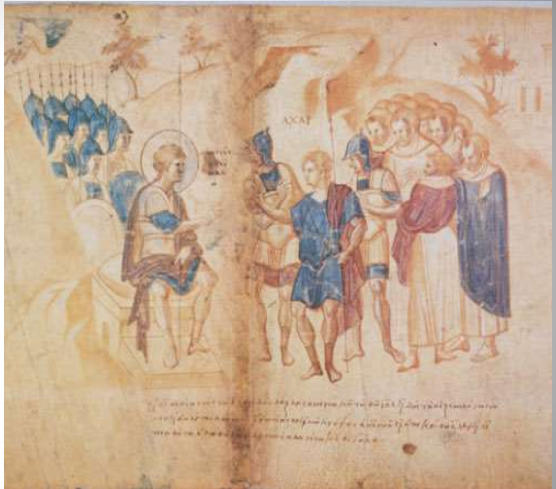
Свиток Иисуса Навина. Ватиканская библиотека