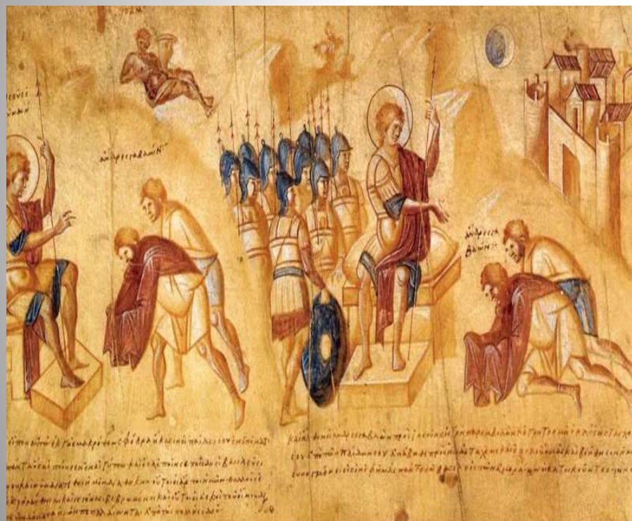
Иисус Навин и мужи Гаваонские. Миниатюра "Свитка Иисуса Навина". Середина 10 в. Константинополь. Ватикан, Папская библиотека