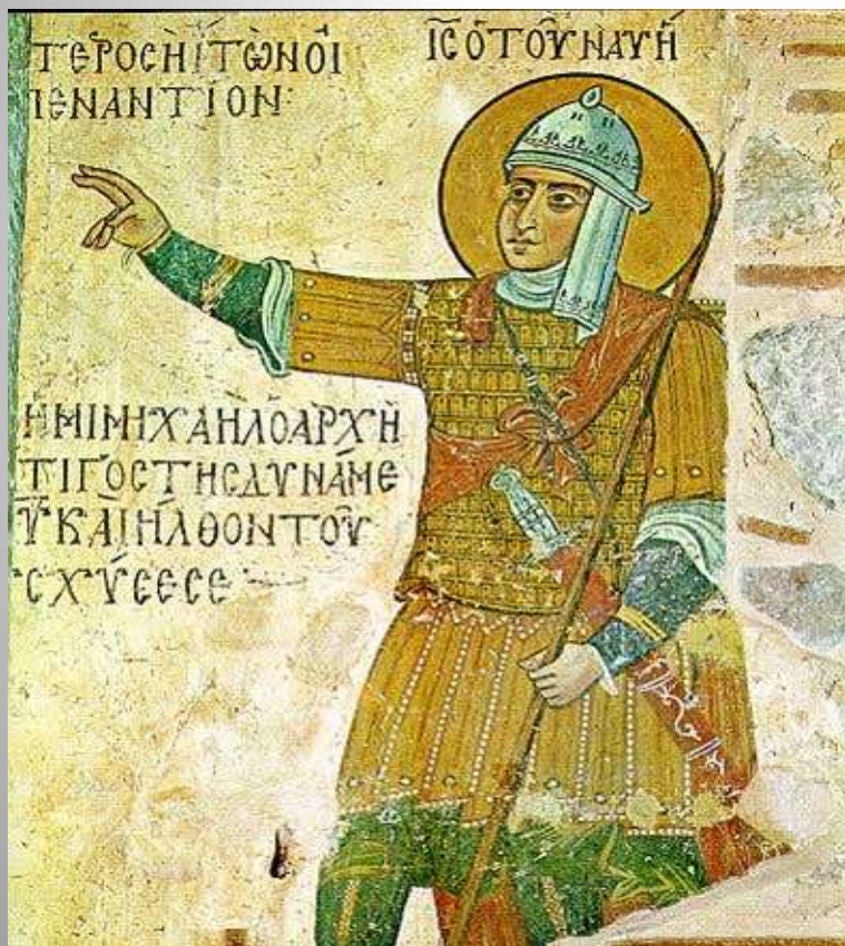
Греческая фреска X в. Монастырь Св. Луки. Афон

Иисус Навин в доспехах Византийского воина