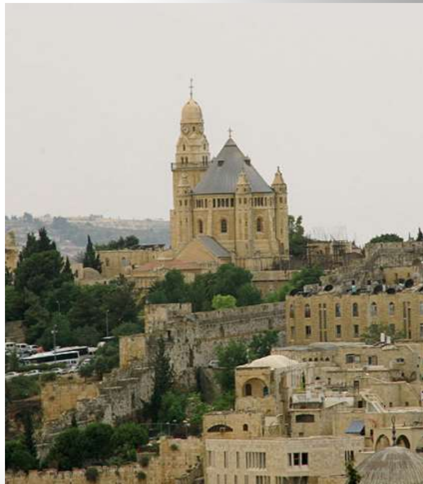
Иерихон. Современный вид