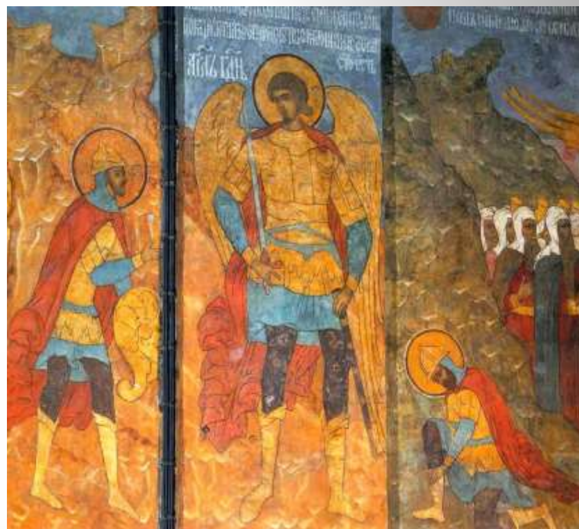
Фреска Архангельского собора Московского Кремля. 1652-1666 гг.

Явление архангела Михаила: укрепление Иисуса Навина