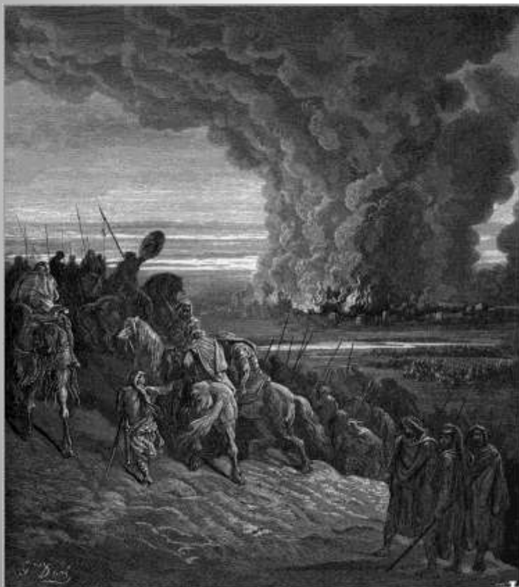
Гюстав Доре. Гравюра

Битва при Гаваоне: Навин останавливает солнце