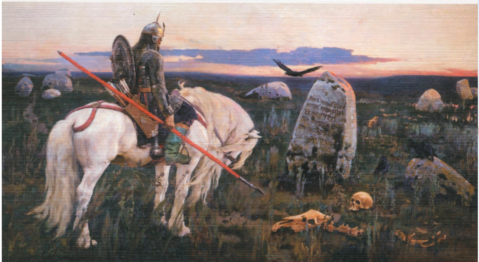
Виктор Васнецов. Витязь на распутье. 1882